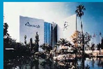
Hotel Rey Juan Carlos, sede del Forum

1° Forum Experian Sud Europa e America Latina il 18 Settembre a Barcellona.